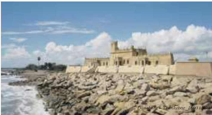
Dansborg - Trankebar 1690 tallet