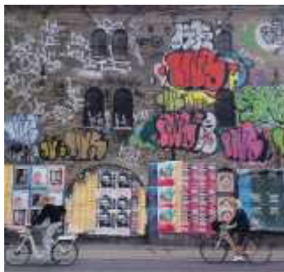
flot grafitti på Loppelyngingen

medlem af Christianshavns Seniorklubs bestyrelse