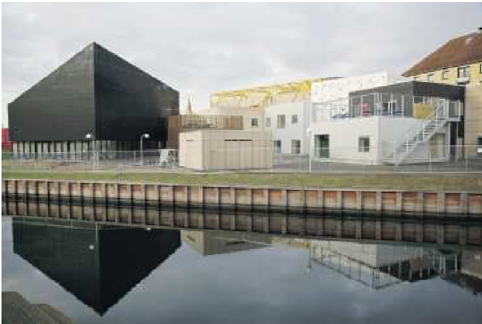
Tekst: Ole W. Ullby